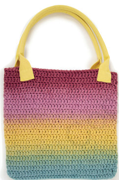
HANDLES COLOR 1 WOW TOTE BAG 304