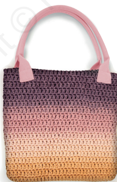
HANDLES COLOR 3 WOW TOTE BAG 301