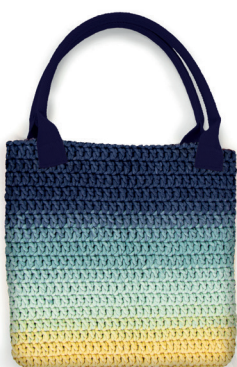
HANDLES COLOR 4 WOW TOTE BAG 300