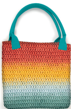
HANDLES COLOR 5 WOW TOTE BAG 303