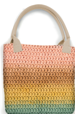
HANDLES COLOR 2 WOW TOTE BAG 302